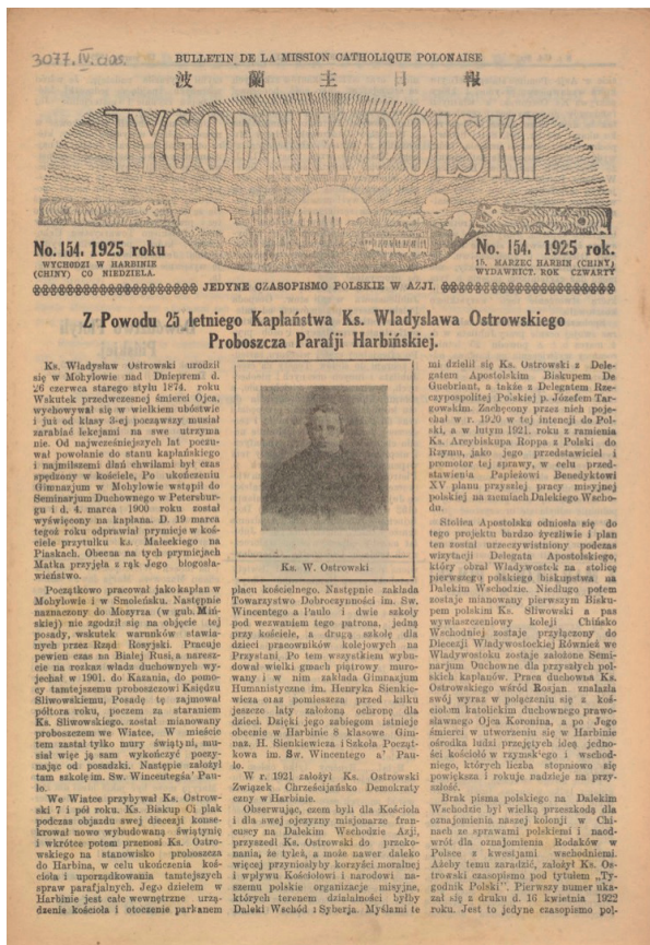
Илл. 2. Журнал «Tygodnik Polski» на польском языке, № 154, 1925 г.

К середине 1930-х годов русская католическая миссия в Китае расширила границы экзархата за пределы Харбина и Маньчжурии. Новые церковные структуры, такие как приходы и школы, были открыты в Шанхае. Попечительство о миссии в Шанхае взяли на себя члены монашеского ордена иезуитов и руководимого ими в Риме «Руссикума» – папской коллегии для подготовки миссионеров священнослужителей византийского обряда. В этом отношении стоит упомянуть уроженца Чехословакии, иезуита Венделина Яворку 28 (илл. 4). В 1934 г. он приехал для осуществления пастырской деятельности в апостольском экзархате для католиков византийского обряда в Китае [Javorka, 2010, 587]. В 1936 г. Венделин Яворка переехал в Шанхай для осуществления миссионерского служения среди русских католиков (в русском католическом храме Св. Николая) [Колупаев, 2013, 586; Колупаев, https://zarubezhje.narod.ru/texts/frrostislav307/ ]. Его служение было недолгим. В 1939 г. он вернулся в Рим для работы в преподава-