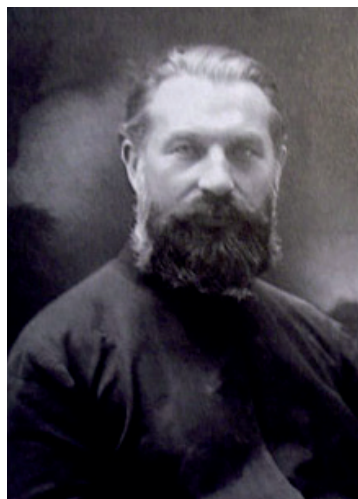
Илл. 4. Фотография Венделина Яворка – пастырского попечителя апостольского экзархата для католиков византийского обряда в Китае (1934–1939 гг.)

Благодаря поддержке и содействию Союза христианских церквей в США, ООН и других международных организаций с конца 1948 г. по май 1949 г. российским эмигрантам была оказана помощь в эвакуации из Китая. Монахи-иезуиты внесли значимый вклад в работу по сохранению ценных русскоязычных религиозных книг, изданных в Харбине, и икон, перевезённых ими в США и частично размещёнными в Русском центре им. В. Соловьева и в домовом храме в Фордамском католическом университете Нью-Йорка [Колупаев, 2013, 13–14]. Русские католики византийского обря-