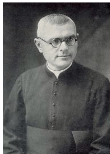
Илл. 3. Фотография Андрея Цикото – архимандрита, экзарха апостольского экзархата Харбина (1939–1952 гг.).