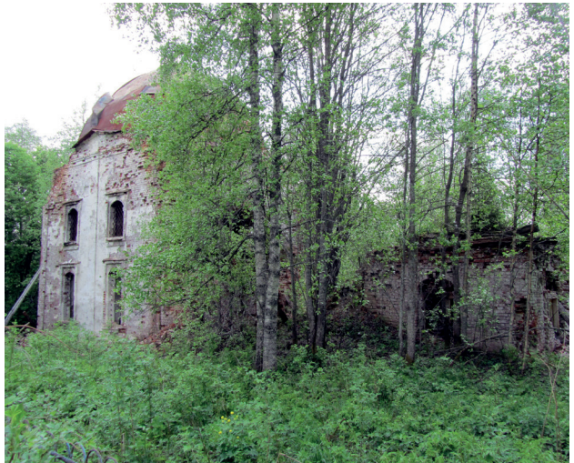
Илл. 3. Церковь в честь иконы Божией Матери «Знамение». Фото А.А. Башкарева, 2012 г.