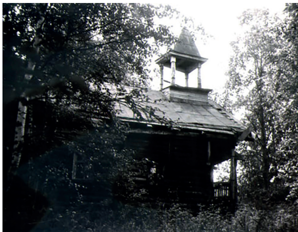
Илл. 4. Часовня в Линхозере. 1986 г.

В названиях часовен и отмечаемых праздниках выделялись имена Николая Чудотворца, Ильи пророка, Спасителя, Богородицы, одна из функций которых, по народным представлениям вепсов, – покровители земледелия [Винокурова, 2015, 139, 277, 287]. Особенностью системы часовенных праздников Знаменского и Высокозерского приходов являлось их скопление в летне-осенний период – время созревания хлебов, начала и окончания жатвы на полях и сбора плодов. В часовенные праздники осеннего периода (от Первого Спаса до Покрова ) было принято приходить на богослужение в храм с колосьями и плодами нового урожая, освящать их, жертвовать святым и угощать односельчан.