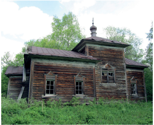
Илл. 2. Церковь великомученика Георгия Победоносца. 2012 г.

Далее в архивном документе говорится, что «по распоряжению епископа икону перевезли в кафедральный собор Петрозаводска» [Пулькин, 2009, 222]. Одна-