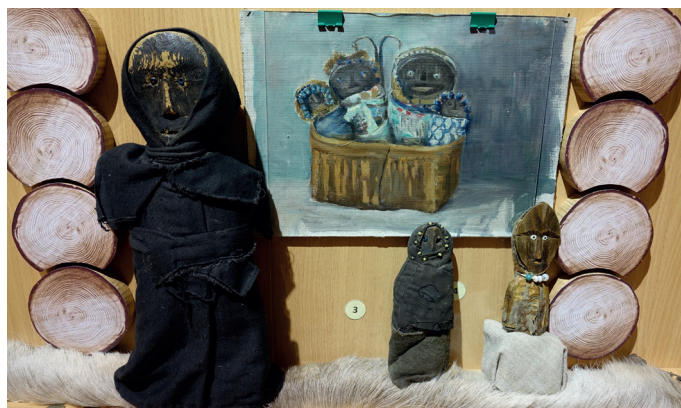
Илл. 1. Изображения селькупских домашних духов на экспозиции Красноселькупского краеведческого музея. Духи стоят на фоне рисунка, изображающего домашних духов (алэлов) кетов, рисунок выполнен братом кетолога Е.А. Алексеевко в 1960-х гг. С. Красноселькуп, Красноселькупский район Тюменской области. 2016 г.

жертвоприношений, состоящий из одежды, бус, бисера, металлических украшений и т.д. В музей кукла поступила в том виде, в каком представлена в культовой экспозиции» [Шапошникова, 2000, 11]. Необычным в фигуре «Женщины в чёрном сахе» является высота – 40 см, что нетипично для изображений домашних духов, обычно их высота не превышает 20 см [Иванов, 1970, 112]. По двум другим духам с той же экспозиции автор детальной информацией не обладает и может дать лишь их описание. Оба духа деревянные, один высотой около 20 см, круглоголовый, зашит в комбинированную из сукна и хлопчатобумажной ткани одежду с платком/капюшоном, по краю капюшона нашиты бусины светло-зелёного и чёрного цвета. Глаза сделаны из голубых бусин, но одна из них утрачена. Понять, есть ли у духа руки-ноги, что у него надето под наружной одеждой, и имеется ли у него рот, не развернув, невозможно (с «Женщиной в чёрном сахе», кстати сказать, похожая история). Другой дух, высотой примерно 14–15 см, остроголовый, близко посаженные глаза сделаны из бусин белого цвета, на лице рельефно обозначены прямой нос, рот, брови, от глаз вверх расходятся вырезанные линии, похожие на длинные ресницы. У духа нет ни рук, ни ног, но сохранились обрывки одежды (с капюшоном) из шкуры, на шею повязана низка бус.