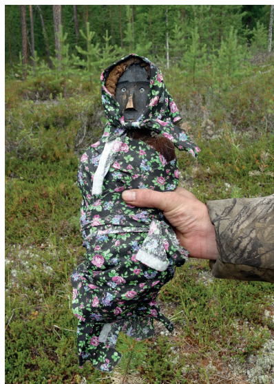
Илл. 4. Изображение селькупского домашнего духа Бабушки. Стойбище на р. Большая Ширта, Красноселькупский район Тюменской области. 2018 г.

На вопросы автора – можно ли вязать на духа ленточки, почему у духа чёрное лицо, из че-