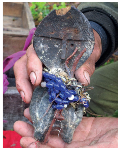
Илл. 3. Изображение селькупского шаманского/домашнего духа Дедушки Тылай Ильджя. Стойбище Белый Яр, верховья р. Толька, Красноселькупский район Тюменской области. 2015 г.