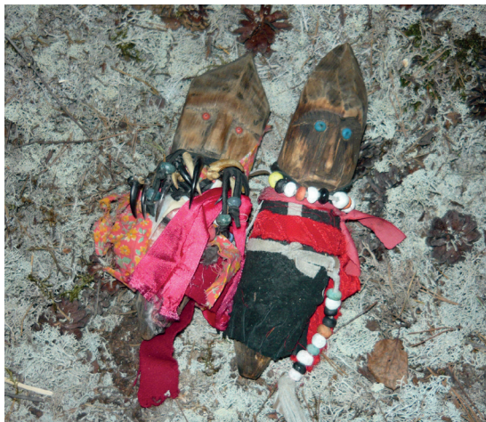
Илл. 2. Изображения селькупских домашних духов Бабушки (духа Огня) и Дедушки. Село Толька, Красноселькупский район Тюменской области. 2012 г.