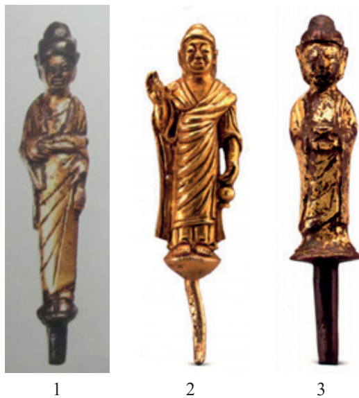
Илл. 2. Буддийские статуэтки во время государства Бохай.

До сих пор ситуация существования цзиньских буддийских храмов (культовых сооружений) на правом берегу Среднего Амура до конца не ясна. Единственным указанием на буддийские культовые сооружения являются археологические материалы, полученные в районе Бэйань. Примерно в 58 км к юго-востоку от городского уезда Бэйань недалеко от с. Лие пос. Шихуа находится чжурчжэньское городище Мяотайцзы. В 200 м к северо-западу от городища находится квадратная высокая площадка из земли и камня площадью около 25 м 2 . Местные