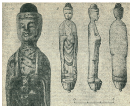
Илл. 1. Буддийская статуэтка из Корсаковского могильника. По: [Окладников, Медведев, 1983, 119].

Генезис и начальное развитие буддизма Бохая связаны не только с проникновением и влиянием буддийской культуры династии Тан, но также с усвоением буддизма Когуре, развившегося в бассейне р. Туманная. Материалы раскопок храма Краскинского городища указывают на