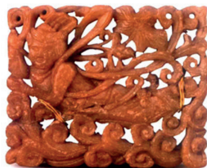
Илл. 4. Каменная скульптура с изображением апсары из чжурчжэньского могильника Чжунсин.

Погребения по обряду кремации у чжурчжэней возникли относительно поздно, несомненно, что время в государственной период их истории они уже существовали. Такие погребения в большом количестве открыты в бассейне р. Ашихэ и в среднем течении Сунгари в окрестностях Цзиньшанцзин – могильник Шуанчэнцунь [Янь Цзинцюань, 1990], Цзиньчэнцунь [Ван Чуньлэй, 2002], Синьсянфан [Ань Лу, 1984; Хэйлуцзянский провинциальный музей, 2007], Хуабинь [Цзин Ай, 1984], семейное кладбище Ваньянь Сииня [Инь Госин, 2008] и другие. Обряд захоронения с кремацией в могильнике у с. Новицком (XII–XIII вв.) в Приморье состоял в том, что после сожжения останков прах помещали в керамическую или деревянную урну, которую устанавливали на плоский камень в яме [Артемьева, 2018, 2020]. Чжурчжэньские могильники Чжунсин [Отряд, 1977а], Юншэн [Отряд, 1977б], Олими [Цзин Ай, 1977; Фан Минда, Ван Чжиго, 1999] и другие, расположенные на берегах Среднего Амура, в основном представлены кремациями без гроба и