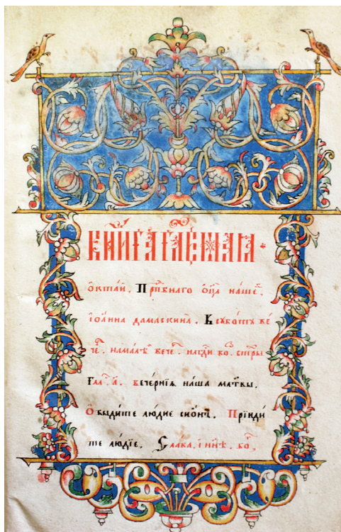
Илл. 1. Октоих на крюках. Нач. XIX в. IX.26р. Л. 1.

Процесс складывания шарташской стилистики оформления рукописей происходил под влиянием нескольких факторов. Во-первых, в основу шарташского книжного декора лёг старопечатный стиль, черты которого можно увидеть в рукописях ещё дораскольного периода, бытовавших у местного населения. Выявленные на территории уральского региона, в частности, хранящиеся в фондах ЛАИ УрФУ, рукописи XVII в. подтверждают факт бытования классической старопечатной стилистики (XIV.44р), либо с элементами барочного декора, возможно, скопированных с цельногравированных печатных листов Оружейной палаты (XXVII.17р). Привезённые переселенцами из центральных районов России книги, как правило, были насыщены большим количеством киноварных инициалов, а также заставками с различными схемами старопечатного стиля. Да и сами печатные книги давали образцы декора, который заимствовался оформителями рукописей. К числу наиболее ранних орнаментированных рукописей, которые гипотетически можно отнести к изготовленным на Шарташе, является список Октоиха на крюках середины XVIII в. (Илл. 2). В конце книги на л. 1 пустом есть запись о её приобретении в деревне Сарапулке Шарташской волости в 1788 г. Здесь представлен декор классического варианта старопечатного стиля, который был распространён в рукописях многих российских регионов. Поэтому со всей определённостью сказать, была она создана местными мастерами, или же была завезена