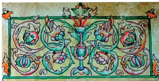
Илл. 8. Праздники крюковые. Кон. XVIII в. VI.203р. Л. 2.