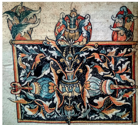
Илл. 2. Октоих на крюках. Сер. XVIII в. VII.274р. Л. 18 об.

Показательным образцом шарташского декора можно считать схему заставки, разработанную местными мастерами, которая встречается достаточно часто в рукописях шарташского письма (Илл. 1, 3, 4, 8). Её удалось обнаружить в трёх списках собрания Уральского университета (I.8р, VI.203р, IX.26р) и в одном из частных собраний (Д. Ноговицына). Все списки относятся ко времени активной деятельности скитов и времени расцвета шарташского стиля оформления книг. Ри-