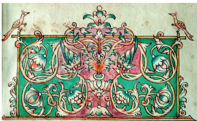
Илл. 3. Октоих на крюках. Нач. XIX в. IX.26р. Л. 3.

сунок заставки в этих рукописях несколько варьируется, поскольку общая схема, зачастую, дополнялась какими-то своими деталями, – где-то по центру менялся узор цветка, где-то добавлялись мотивы птиц и др. Заставка могла менять цвет, а также отдельные элементы, но общий структурный «скелет» оставался неизменным. Подобная заставка могла не только переходить из одной книги в другую, но и варьироваться в рамках одной рукописи, как например, в Октоихе начала XIX в. (IX.26р. Илл. 1, 3).