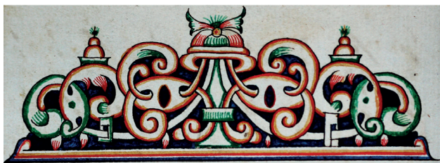
Илл. 5. Обиходник и Октоих на крюках. Кон. XVIII в. I.8р. Л. 184 об.