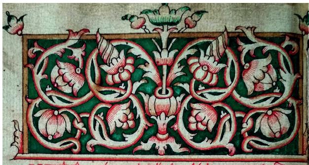
Илл. 4. Обиходник и Октоих на крюках. Кон. XVIII в. I.8р. Л. 40 об.

Влияние ветковской стилистики можно проследить по декору Праздников конца XVIII в. (Илл. 7). Здесь есть и плавные переходы цвета, и использование тёплых натуральных тонов. Фоны заставок, зачастую, приобретали характерную бирюзовую окраску. Такой нежный бирюзовый цвет часто использовался на Ветке. «Ветковский след» обнаруживается и в схемах концовок. В этой рукописи вновь можно встретиться с характерной особенностью шарташского оформления рукописей – в одном списке соединение двух стилистик, в данном случае – ветковской и