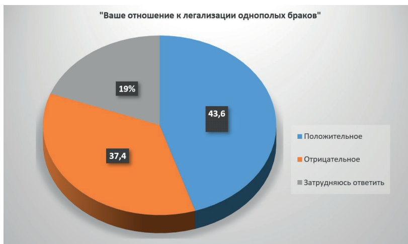
Рис. 1. Распределение ответов на вопрос «Ваше отношение к легализации однополых браков»

Блок вопросов, направленных на изучение отношения молодых людей к «новым ценностям самовыражения» включал в себя вопросы, связанные с заменой понятий «мама» и «папа» на «родитель 1» и «родитель 2», с легализацией однополых браков и усыновления детей гомосексуальными парами, а также к движению чайлдфри.