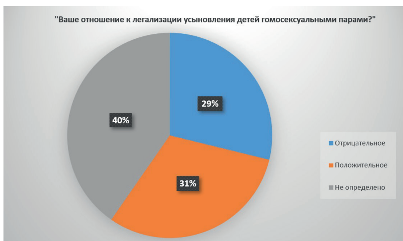
Рис. 2. Распределение ответов на вопрос «Ваше отношение к легализации усыновления детей гомосексуальными парами?»

Результаты опроса демонстрируют рост толерантности по отношению к ЛГБТ сообществу у студенчества, быструю динамику в изменении общественного сознания (окно Овертона). Для сравнения: в выпускной квалификационной работе, выполненной под руководством одного из авторов статьи в 2016 году, среди молодых людей из разных городов Сибири в возрасте от 16 до 30 лет процент противников легализации браков составлял 91%, а усыновления детей – 98,9%.