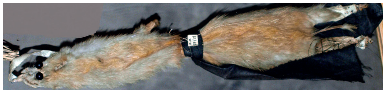
Илл. 4. Холанах тӱс – «Колонковый фетиш» Из коллекций Минусинского краеведческого Музея им. Н.М. Мартыанова

Подобно Кӱзен тӱс'у колонковый тӱс чаще встречался на севере Хакасии у кызыльцев. Он имел следующий вид. Целая шкурка колонка опоясывалась красной или чёрной лентой (Илл. 4). Подвешивался в незаметных для посторонних глаз местах, чаще за чувалом либо в одном из углов юрты на женской половине. Следует заметить, что его нередко размещали рядом с Тӱлгӱ тӱс'ем 69 .