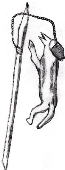
Илл. 1. Tülgü töc . Перерисовано Д.Ц. Цыденовой из кн. Иванов С.В. Скульптура алтайцев, хакасов и сибирских татар (XVIII – первая четверть XX в.). Л.: Наука, 1979. С. 131. Рис. 142.1

Новые интересные сведения о Tülgü töc'e были приведены и в монографическом исследовании С.В. Иванова «Скульптура алтайцев, хакасов и сибирских татар» 26 . Им были рассмотрены два варианта лисьего фетиша. Один из них полностью соответствовал одному из вышеописанных. Так, например, он представлял собой целую лисью шкуру, снятую с оставлением головы и при этом дополненную лоскутами красной и чёрной ткани. Вторая же разновидность этого töc'a имела весьма оригинальный вид. Её изготавливали следующим образом. Из куска кожи козы с красноватым мехом вырезалась фигура лисы. При помощи шнура она привязывалась к палочке, длина которой составляла 15 см 27 (Илл. 1).