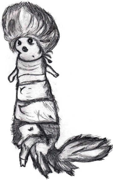
Илл. 2. Хачай / Тиин тӧс . Перерисовано Д.Ц. Цыденовой из кн. Иванов С.В. Скульптура алтайцев, хакасов и сибирских татар (XVIII – первая четверть XX в.) . Л.: Наука, 1979. С. 130. Рис. 141